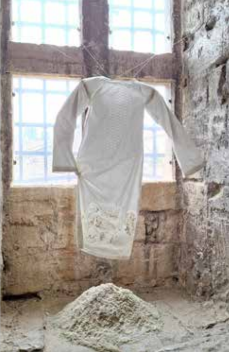
Installation par la promotion 2024