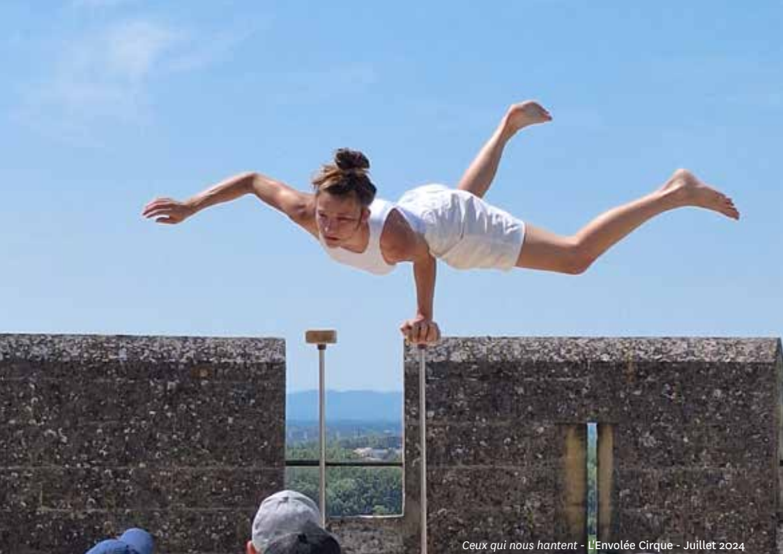
Ceux qui nous hantent - L'Envolée Cirque - Juillet 2024

Avant votre visite, consultez les modalités d'accès sur : www.fort-saint-andre.fr