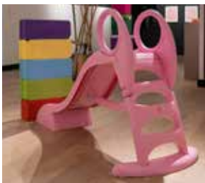
Tobocrash © Luc Texier

Dessins naïfs et spontanés, calligraphie hésitante, caractérisent ses œuvres avec lesquelles constamment elle joue.